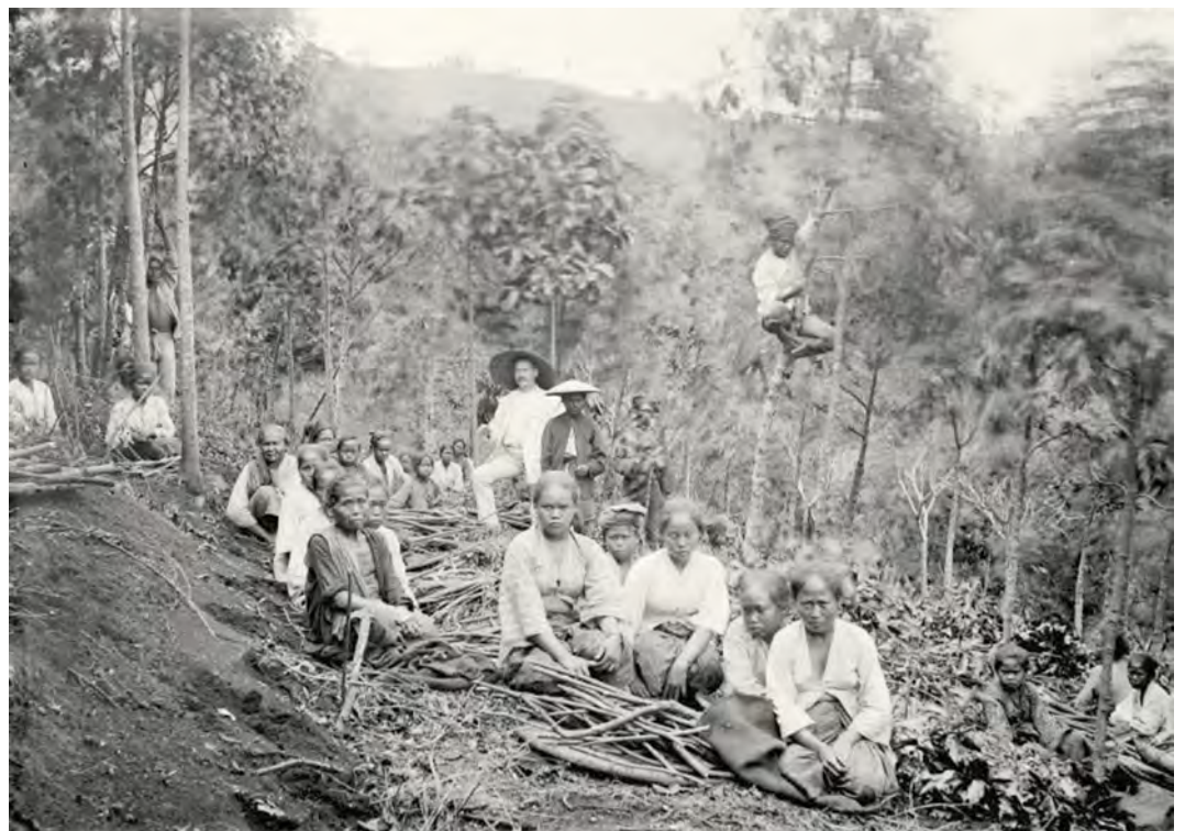
Vrouwen doen gedwongen arbeid binnen het Cultuurstelsel.

Met het Cultuurstelsel probeerde Nederland zoveel mogelijk winstgevende producten te laten verbouwen. De autochtone bevolking werd gedwongen tegen een zeer geringe vergoeding bijvoorbeeld suikerriet te verbouwen, wat heel arbeidsintensief is. Door deze dwangmaatregelen bleef er onvoldoende grond over om rijst te verbouwen, wat leidde tot hongersnood. Als protest werden er door de bevolking rietvelden in brand gestoken.