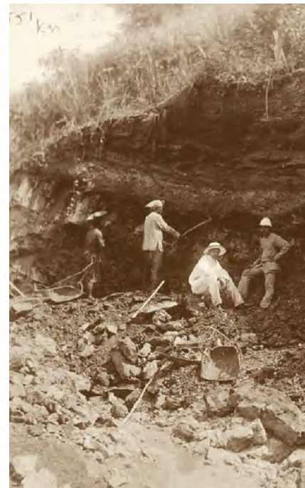
De lucratieve tinmijnen van Bangka en Biliton.