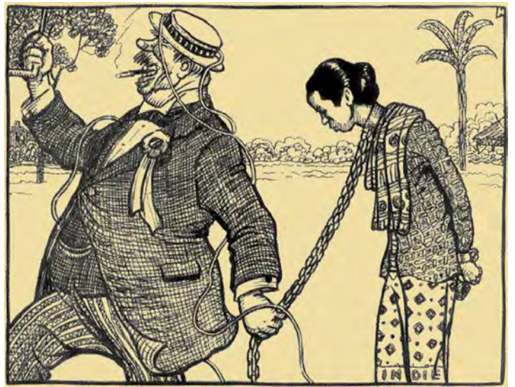
Leve de Onafhankelijkheid! — Tekening van Albert Hahn

Slaven bij de waterpoort te Batavia, J. Rach, 1767. (Rijksmuseum Amsterdam, NG-400-)