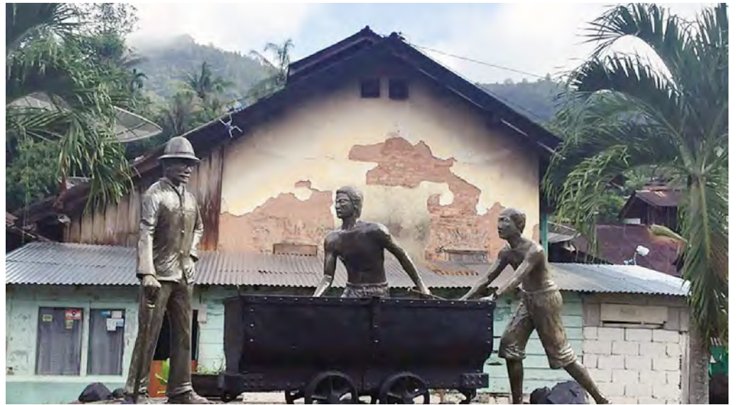
Het monument in Sawahlunto op Sumatra voor de 'orang rantai', kettinggangers: dwangarbeiders in de kolenmijnen.